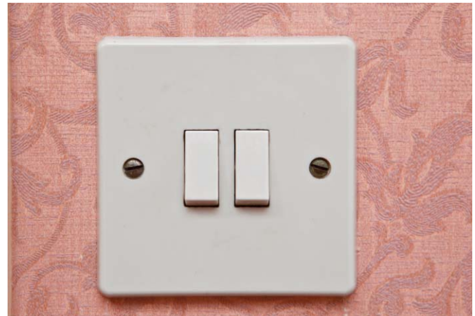
Yn ystyried newid?

Mae mesuryddion rhagdalau yn gweithio ar sail talu wrth fynd. Gallwch ychwanegu arian at gerdyn neu allwedd mewn man talu a'i osod yn y mesurydd sy'n ychwanegu'r credyd sydd ar gael i chi. Mae rhai pobl yn hoffi mesuryddion rhagdalau gan eu bod yn cynorthwyo gyda